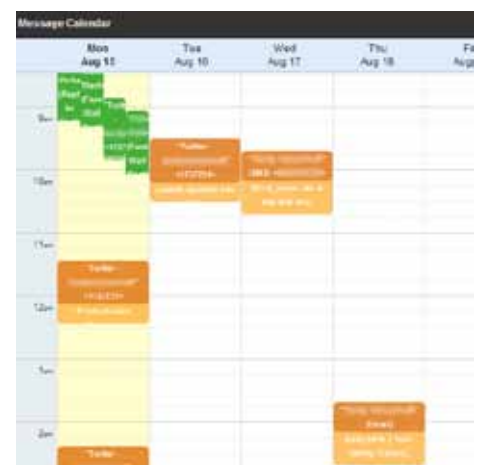
Afbeelding 4: planner communicatie momenten