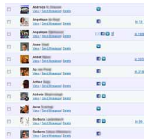
Afbeelding 5: adresboek met contacten en groepen