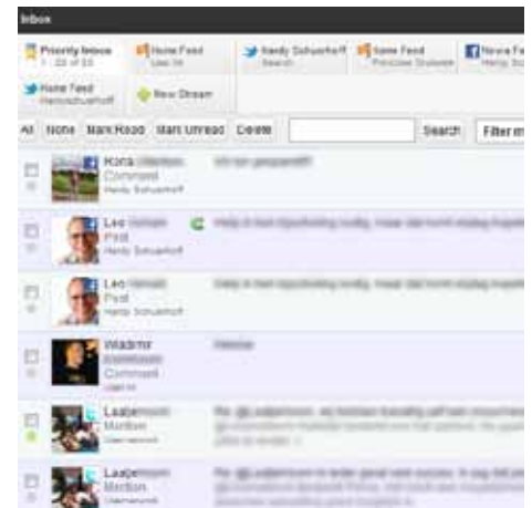
Afbeelding 3: monitoren en beantwoorden inkomende berichten